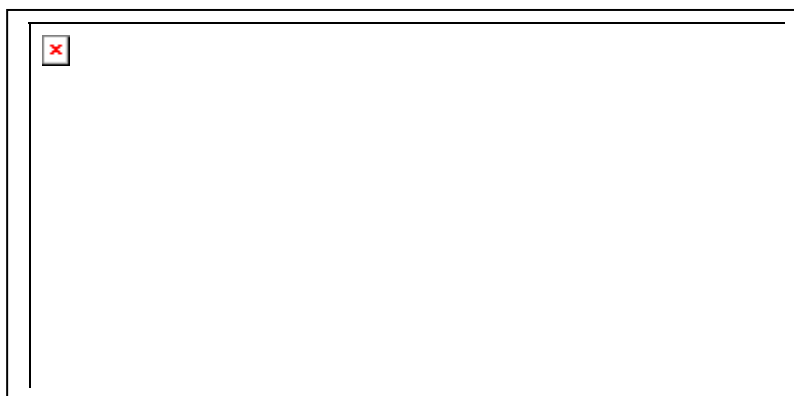
Figura 6.-Representación gráfica en forma de barras de cada uno de los puntos de medida instalados en la caldera.